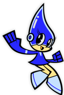
伊万里市防火協会 マスコットキャラクター マリンちゃん