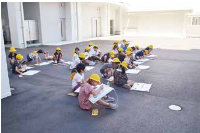
東山代小学校でのスケッチ風景

毎年好評の「出前消防スケッチ」ですが、今年度は、立花小学校、二里小学校、東山代小学校、山代東小学校の4校に消防車と救急車で出向きスケッチをしていただきました。 この出前消防スケッチは、消防車等のスケッチを通して消防業務を身近に感じてもらい、少年期における防火意識の高揚を図ることを目的として実施しています。 入賞作品は、3月1日(日)から3月7日(土)までの春の火災予防運動にあわせて伊万里市民図書館に展示する予定です。