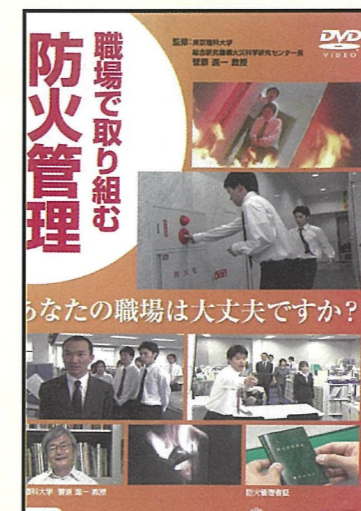
職場で取り組む防火管理 内容：職場での防火管理について 収録時間：15分