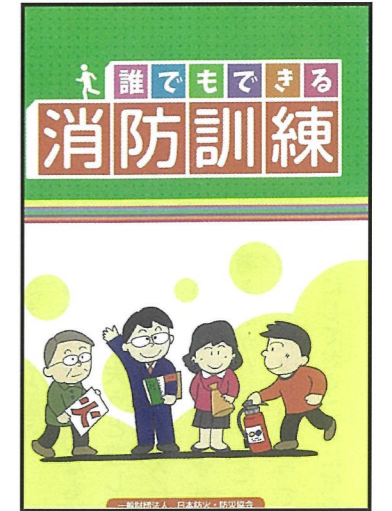
誰でもできる消防訓練 内容：消防訓練の方法を紹介 収録時間：17分