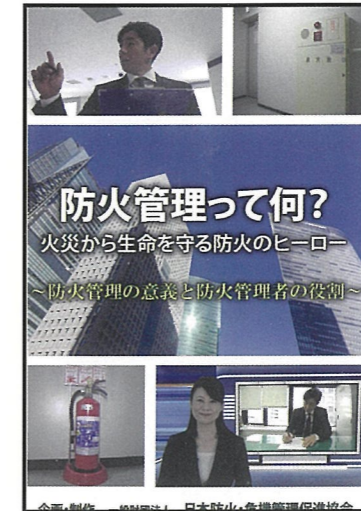
防火管理って何? 火災から生命を守る防火のヒーロー 内容：防火管理者の役割 収録時間：12分