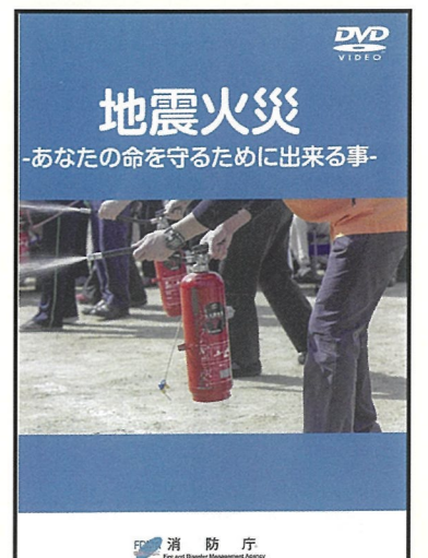
地震火災 あなたの命を守るために出来る事 内容：地震による火災のメカニズム 収録時間：15分