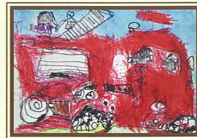
優秀 前山 輝希 (二里小)