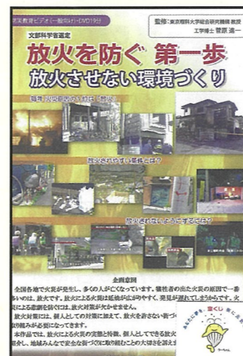
放火を防ぐ第一歩 放火させない環境づくり 内容：住宅周辺における放火対策 収録時間：19分