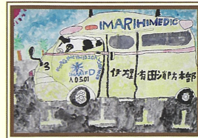
優秀 藤森 奉 (二里小)