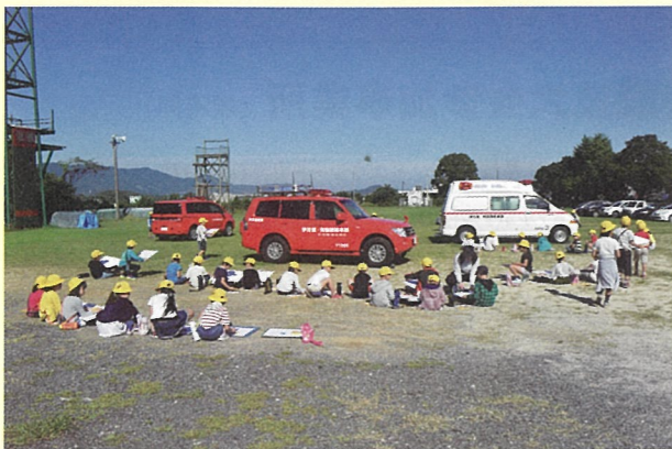
立花小学校2年生のスケッチ風景