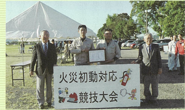
優勝した名村Aチーム