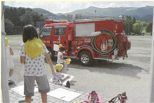
山代西小学校でのスケッチ風景

毎年好評の「出前消防スケッチ」。今年度は、山代西小学校、立花小学校、大坪小学校、大川内小学校の4校に消防車と救急車で出向いてスケッチをしてもらい、293点の応募がありました。 この出前消防スケッチは、消防車等のスケッチを通して、消防業務を身近に感じてもらおう事で、少年期における防火意識の高揚を図ることを目的として実施しています。 応募された作品は、春の火災予防運動に併せて伊万里市民図書館に展示する予定です。