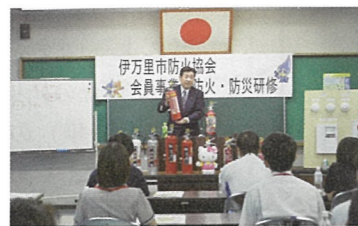
消防用設備等取り扱い説明