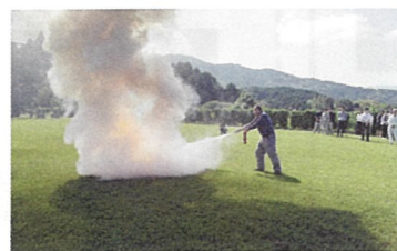
消火器での消火訓練