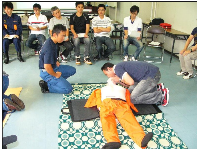
一般公募による普通救命講習（救急の日）