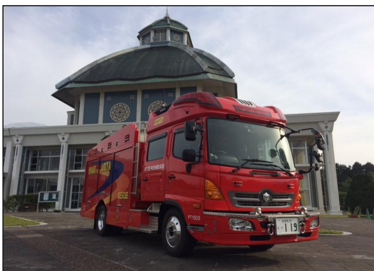
平成26年度伊万里・有田消防組合配備車両 救助資機材積載型水槽付消防ポンプ車 有田消防署配備