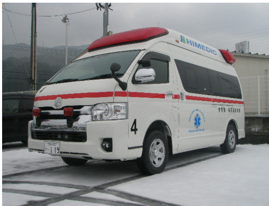
平成27年度伊万里・有田消防組合配備車両 高規格救急車 伊万里消防署配置