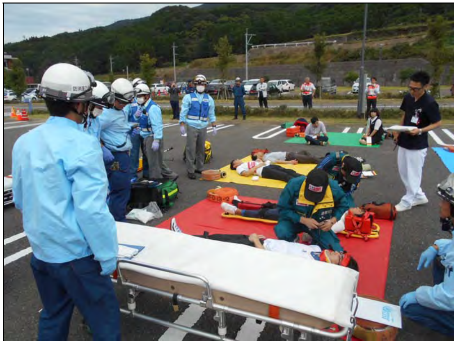
伊万里有田共立病院との合同訓練（多数傷病者）