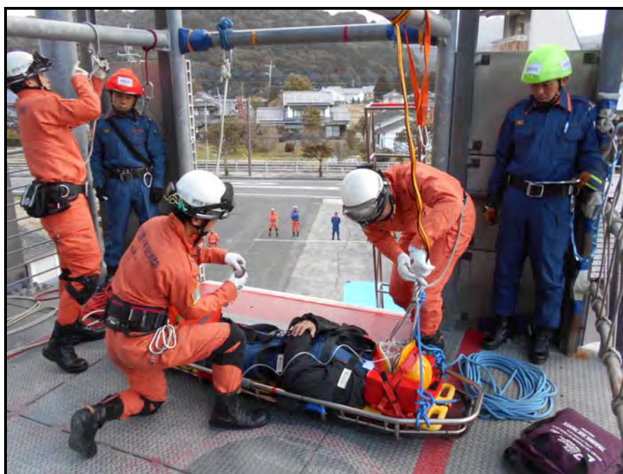
平成28年度 救助技術基本訓練