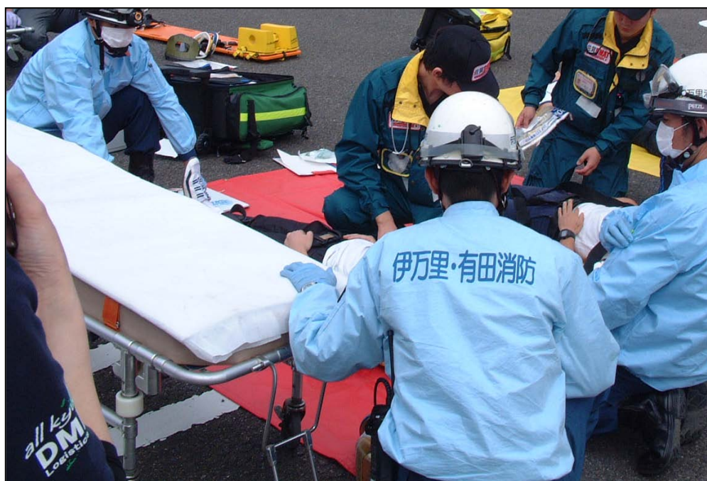
伊万里有田共立病院との合同訓練（多数傷病者）