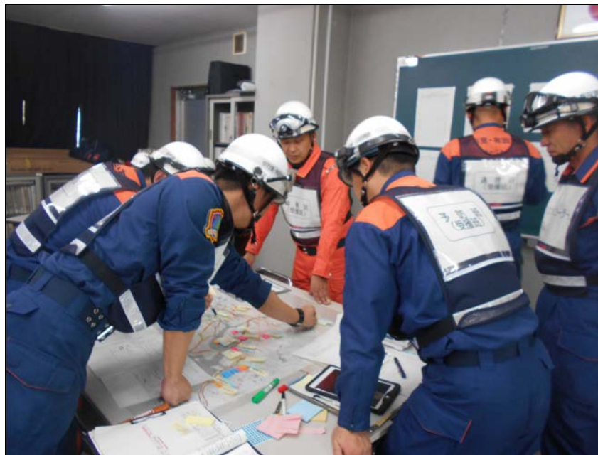
平成29年度 大規模災害図上訓練