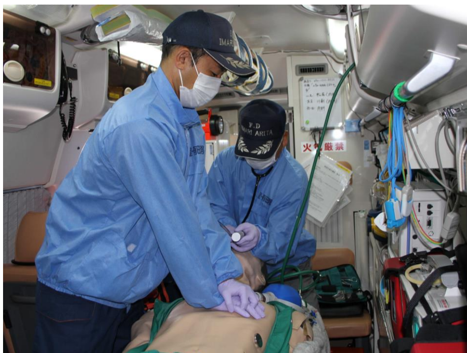
救急隊の日常訓練風景