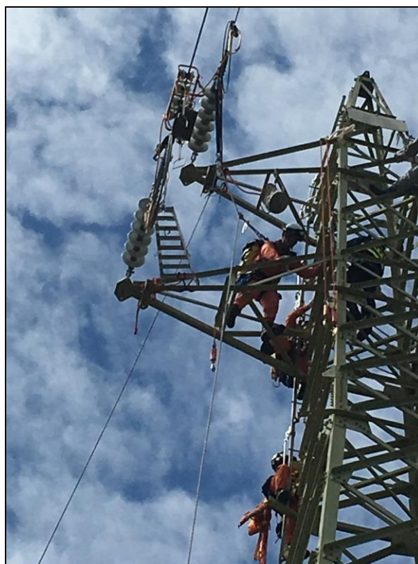
送電線塔上救助訓練(平成30年)