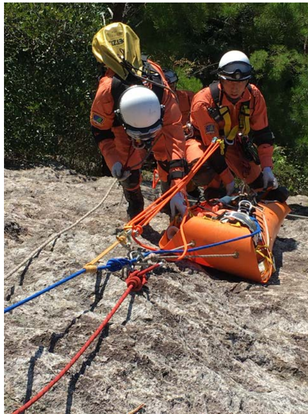
山岳救助訓練風景