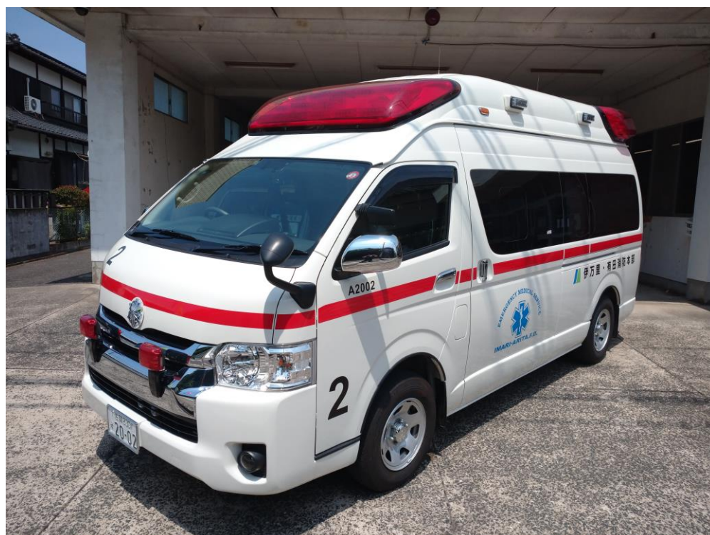
伊万里救急2（令和2年2月導入）