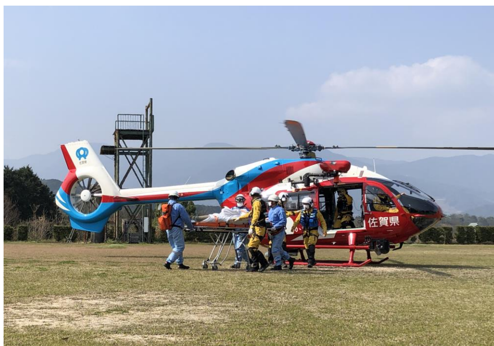
佐賀県防災航空隊と合同訓練