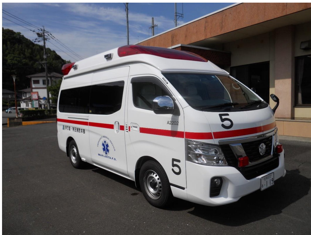
伊万里救急5（令和4年2月導入）