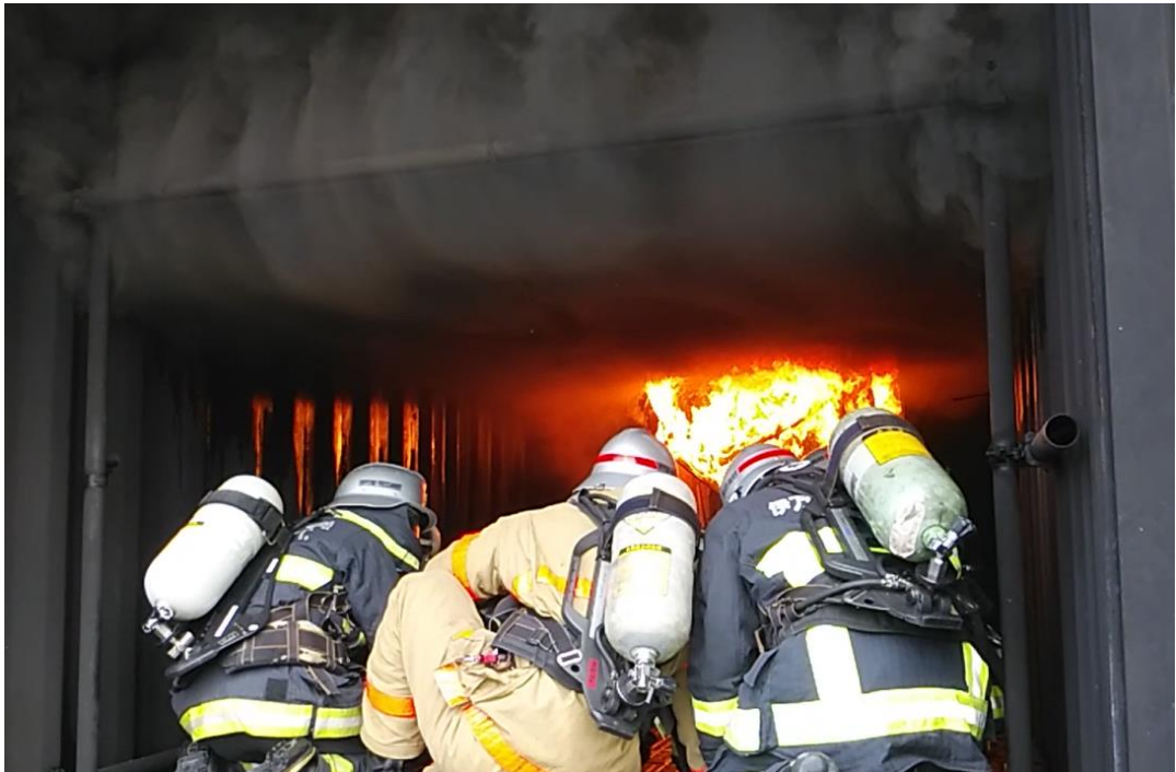
実火災体験型訓練（佐賀県消防学校）