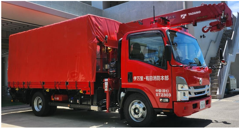
有田消防署 配備車両 資器材搬送車