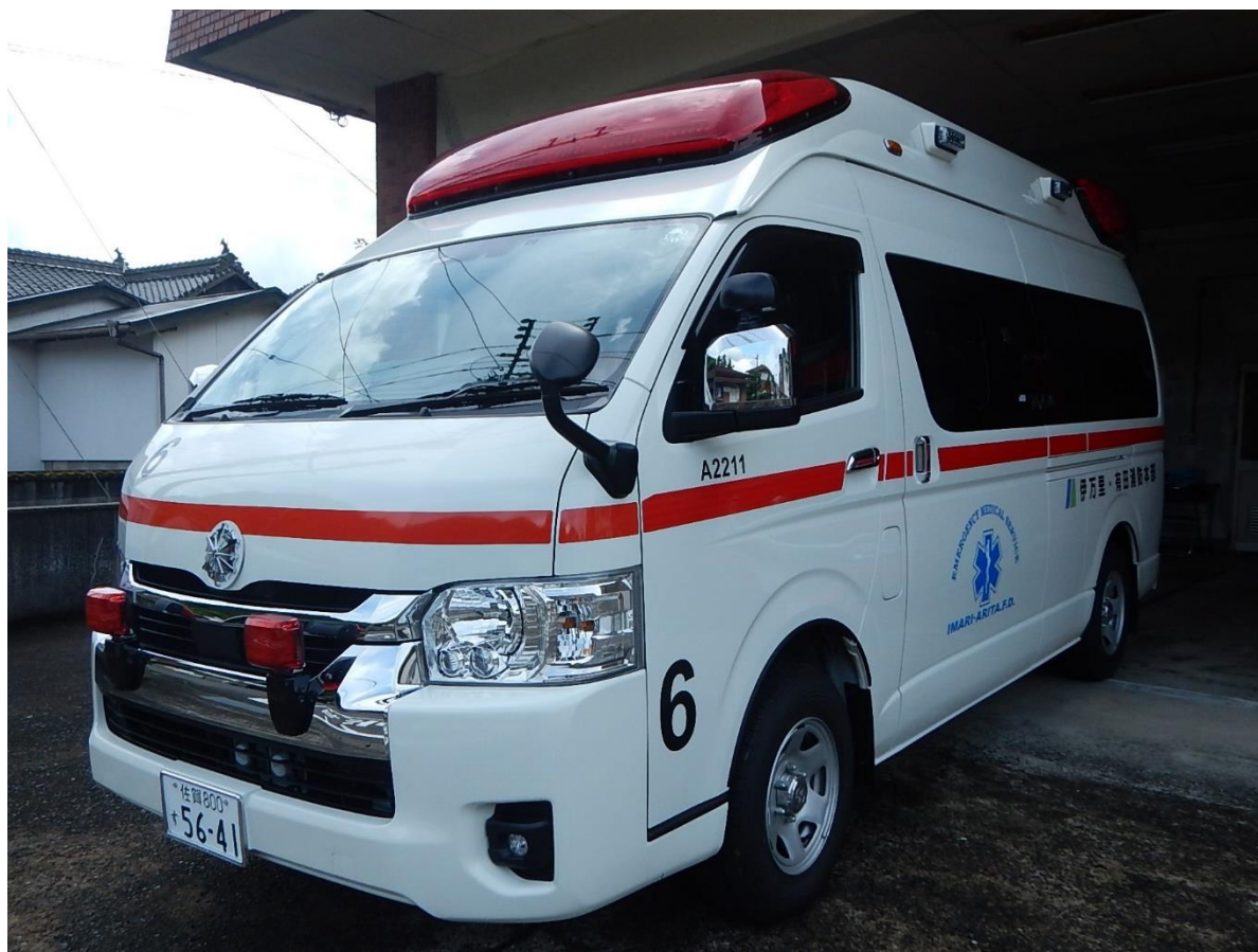
伊万里消防署 東分署 配備車両 高規格救急車